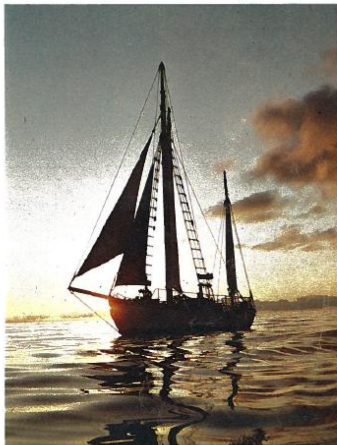
I to uker sto brisen stødig fra sørvest.