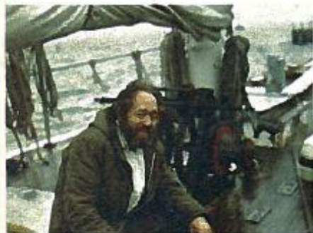
Vi seilte forsiktig. Skipperen betenker om storseilet skal opp etter en god blåst.